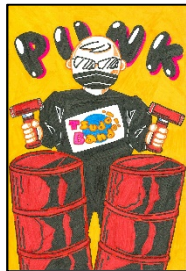
チャレンジ賞 『勝手にまきやがれ！！』 伊藤康憲 (愛知県一宮市)