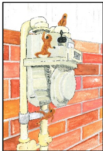
銀賞 『夢の中に出てきた、 小動物の遊び』 ハル (神奈川県横浜市)

第14回「一枚のはがき」アートコンテスト テーマは「私の好きなたべもの2024」 応募期間 2024. 4. 1～10. 31 (詳細はリフレット参照) たくさんのご応募お待ちしております。