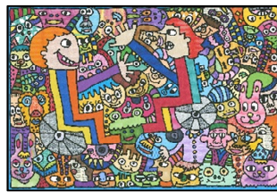
銅賞 『車イスで宇宙にトリップ』 カミジョウ ミカ (長野県安曇野市)