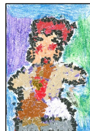
チャレンジ賞 『歌舞伎』 四ヶ所文恵 (福岡県北九州市)