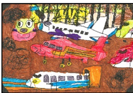
審査員特別賞 『とらにあいたい』 立藤紳史 (愛知県一宮市)