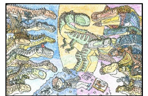
チャレンジ賞 『ドリーム・ ダイナソー・ワールド』 水上泰樹 (千葉県成田市)