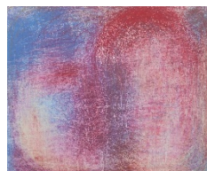
審査員奨励賞 「あか あか しかく」 のりみち(三重県松阪市)

日本のモノを大切にすることを『もったいないをありがとう』運動として、マレーシアなどアジアの発展途上国の子どもたちの支援と日本のセーフティーネットの人々に活用する福祉の仕組みを創りました。ご家庭でまだ使えるけど不要となった、でも捨てるのは「もったいない」ものがありましたら、WACへお持ちください!!