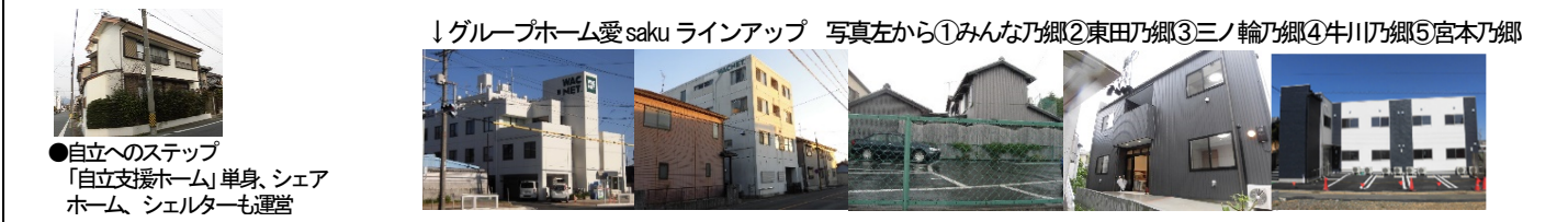
↓グループホーム愛saku ラインアップ 写真左から①みんなの郷②東田の郷③三ノ輪の郷④牛川乃郷⑤宮本乃郷 ●自立へのステップ 「自立支援ホーム」単身、シェアホーム、シェルターも運営