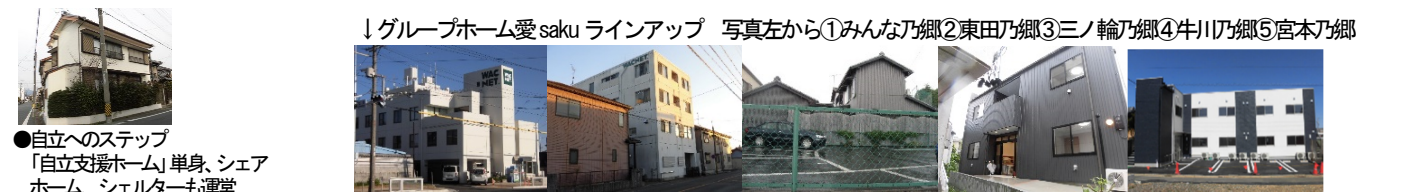
↓グループホーム愛saku ラインアップ 写真左から①みんなの郷②東田の郷③三ノ輪の郷④牛川乃郷⑤宮本乃郷 ●自立へのステップ 「自立支援ホーム」単身、シェアホーム、シェルターも運営

定例のGH防災訓練を実施しました。毎年2回は行う予定でしたが、コロナ禍で、すっかり伸び延びになってしまいました。でも、もう何度も行っているの、今回は、かなりスムーズでした。地震災害を想定し、現在6カ所に点在する各GHから、各々の第1避難場所を経過して、最終避難場所へ移動します。今回は、一番、遠いGHからの移動を、第1避難場所までを徒歩、最終避難場所までは、足腰の不自由なメンバーのために送迎で移動したこともあり、すごく難なく移動。日中活動終了後の夕方から開始し、冬季で日の暮れるのが早く、あっという間に暗くなってしまいましたが、ほどよくスムーズな訓練となりました。ただし、それ以外のGHは、皆基本徒歩にてたどり着き、分かりやすい順路のため、問題なく移動できたのが幸いです。本当の震災になった場合は、おそらく、送迎は不可能なため、こうはスムーズには行かない上、雨天の時は、大変になるだろうな、とか、いろいろ考えますが、その場合は、無理せず、まず最寄りの第1避難場所まで待機し、安定したら、合流できるよう、準備していきます。ありがたいことに、第1避難場所は、各々のGHに近い場所なので、比較的、安全。今後も、いざという時に、なんとか、乗り切れるよう、チームワークを強化し、日頃の訓練を続けていきたいと思っております。頑張ります！