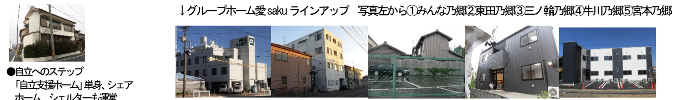
●自立へのステップ 「自立支援ホーム」単身、シェアホーム、シェルターも運営

今回の GH 誕生会持ち帰り外食会は、旨いハンバーグのお店・開化軒のお弁当各種。本格洋食のお店と銘打っているだけに、ハンバーグもボリュームたっぷりの手作り感覚。食べ応えがあります。チーズやエビフライ付きなどに、ポテトフライとスパゲティとお漬物がついてます。他に、チキンカツカレーやチキン南蛮弁当もありました。一番人気は、やっぱりハンバーグにエビフライ。お手製ソースとタルタルソースが別についてきます。たまたまこの日は、台風明けのお天気と夕暮れ時とあって、出来上がり待ち時間、人気が少ない、どの店も苦戦しているんだな、と毎回、痛感します。意外と好調なのが、ファーストフード店のドライブスルー。いつも食事時は、車が連なってます。私たちも、こう長い間、持ち帰り外食会が続いていると、慣れしてしまうところもあるし、混んでいる店は行きたくない、という感覚になってきます。新型コロナ禍のおかげで、どこも混雑しなくなってきたので、その方がずっとラクで居心地はいい。でも、やっぱり、食事は、出来立てを、その場で食べたいというのも本当のところ。いつになったら、以前のように、皆で、外食会に繰り出せるのだろうか…と考えつつも、持ち帰り弁当、今回も、とても美味しかった、と好評に終わりました。来月も、お楽しみに！